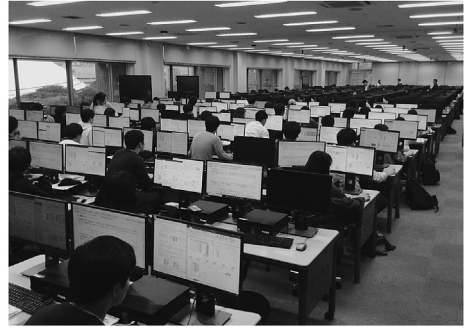
図 1 「OR 演習」の風景

OR を直接冠した科目としては先述の「OR 第 1」(1 年次必修)や、線形計画や離散時間マルコフ連鎖を扱う「OR 第 2」(2 年次選択)の座学のほか、「OR 演習」(2 年次必修)があります(いずれも後藤が担当しています)。「OR 演習」は Microsoft Excel を用いて PERT や在庫管理、ポートフォリオ選択、待ち行列、AHP などのトピックを学ぶという内容で、教員が用意した資料を読みながら、学生が各自のペースで演習に取り組みます。図 1 は後楽園キャンパスの IT センターでの演習風景で、2018 年度は 160 名ほどの学生が取り組みました。こうした OR の名がついた科目以外にも、後藤が担当する「最適化手法」ではネットワーク最適化、整数計画などの離散最適化を、生田目が担当する「システム工学」ではデータ包絡分析(IDEA)のほか、連続最適化の基礎を扱っています(いずれも 3 年次選