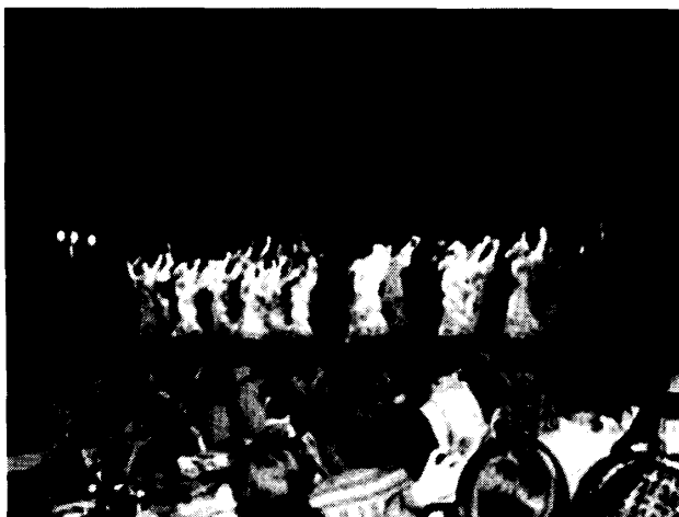
ディナーパーティー

ゃな色白タイプまで様々だったが、あとで聞いたところによると、ほとんど全員、それぞれの地域からのハワイ大学への留学生とのことであった。このようなショーを見るにつけても、ハワイがまさに“常夏の南の島”であるという印象を持った。